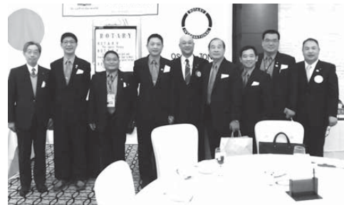
豊原北區RCの皆様と

裁判では、Aが痴漢の意図でVの臀部を触ったのか、つまり痴漢をする意図があったのが争点となりました。今回の痴漢行為は「右手でVの臀部を着衣の上から触った」というものですが、Vの当時の服装は、スカートの上に冬用のダウンコートを着ていたため、Aの右手がVの臀部付近に当たってはいるものの、その態様は厚みのあるコートの上から単純に押すというものであって、接触の時間も一瞬よりやや長いとはいうものの、ごく短時間だったのです。裁判官は、この態様から直ちに痴漢の意図で触ったと即断することはできないと言って警察官やVの証言の信用性に疑問を抱き、AがVを狙っての執拗な痴漢行為であるとの検察官の主張を排斥して無罪を導きました。Aは幸いにも冤罪を免れましたが、判決後休職となっていた会社を退職しました。前途有為な青年にとって裁判は、結果以上に過酷であったようです。